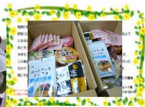
各家庭に送る段ボールには、30～35種類の食品を詰めて発送しました