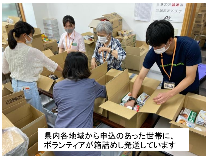
県内各地域から申込のあった世帯に、ボランティアが箱詰めし発送しています

このプロジェクトに協賛する企業や団体、市民などからの食品寄贈など支援活動が広がっています。また、プロジェクトに協賛するフードドライブの開催が広がり、県庁や地域振興局、県内各地域の関係団体など開催が進んでいます。